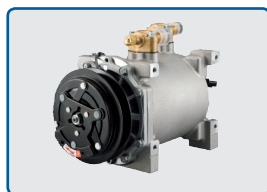
Sprężarka spiralna 3D

* waga łącznie ze sprężarką, akcesoriami i orurowaniem