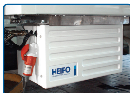
Zestaw gotowości do chłodzenia